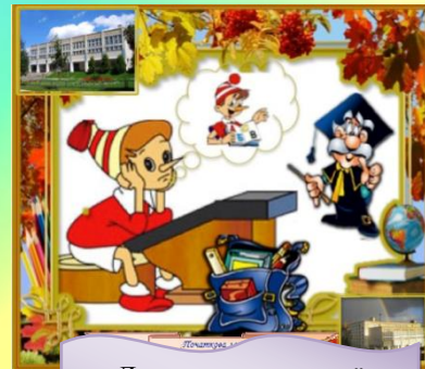
Логотип початкової школи