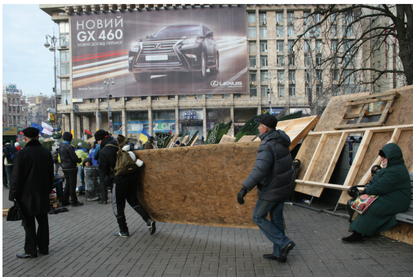
Будування барикад на Майдані, грудень 2013.

Паралельно режим намагався створити подобу Євромайдану – «Антимайдан», аби імітувати громадську підтримку влади. На початку грудня 2013 року до Києва були зведені кілька тисяч осіб. Табір «Антимайдану» розташувався у Маріїнському парку поблизу Верховної Ради.