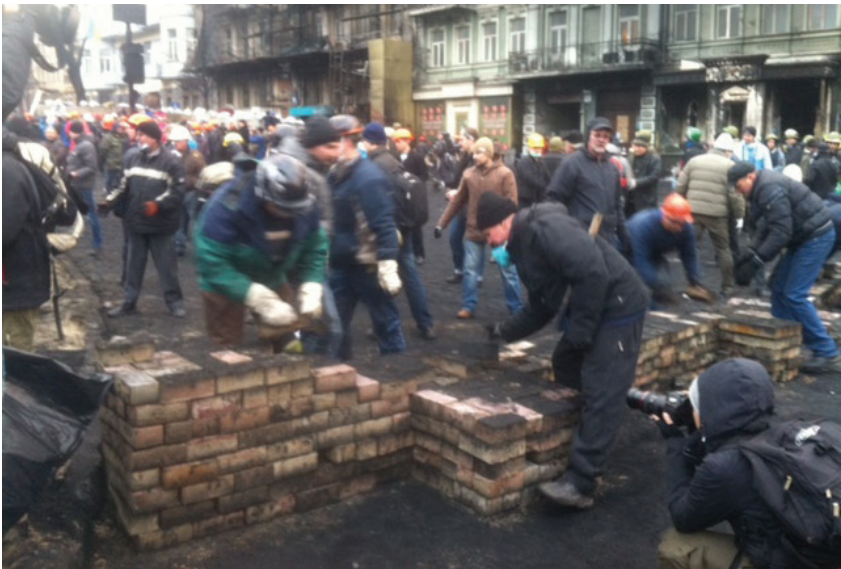
Відновлення барикад на Майдані незалежності та вул. Грушевського після розстрілу героїв «Небесної сотні» 20 лютого.