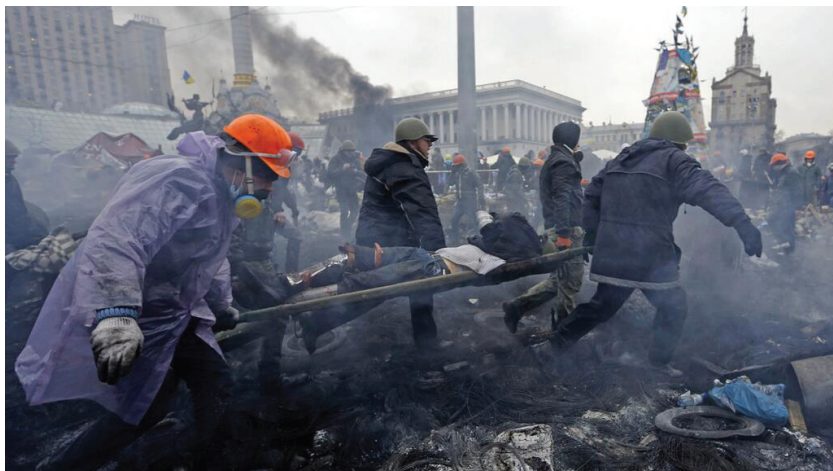
Майдан у вогні, лютий 2014.