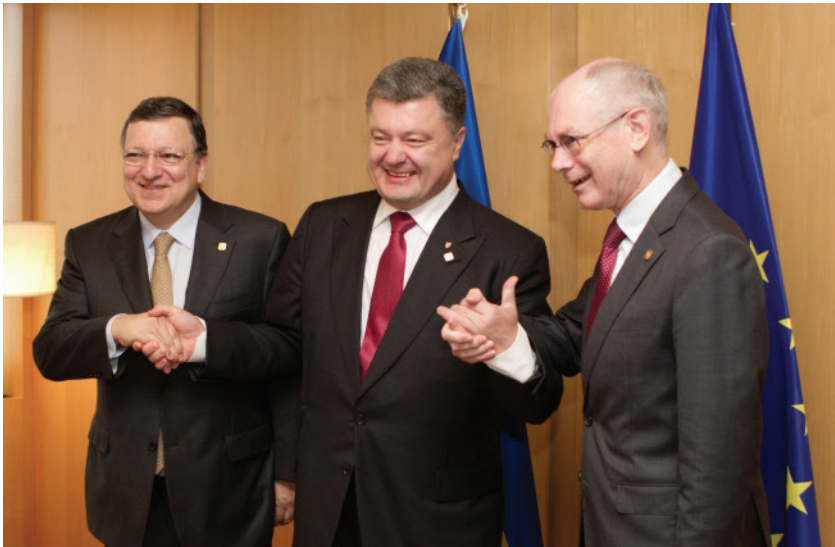
Підписання Угод про Асоціацію 27 червня 2015 року. Президент Європейської комісії Жозе Мануель Баррозу, Президент України П. Порошенко, Президент Європейської Ради Херман ван Ромпей.

вільної торгівлі, Угодою передбачено співробітництво в інших сферах. Результатом такої співпраці має стати підвищення якості української продукції та кращий захист інтелектуальної власності, більш чисте повітря, лібералізований енергетичний ринок, самоврядування за європейською моделлю та ефективна боротьба з корупцією і відмиванням грошей. На впровадження цих стандартів відводиться до десяти років.