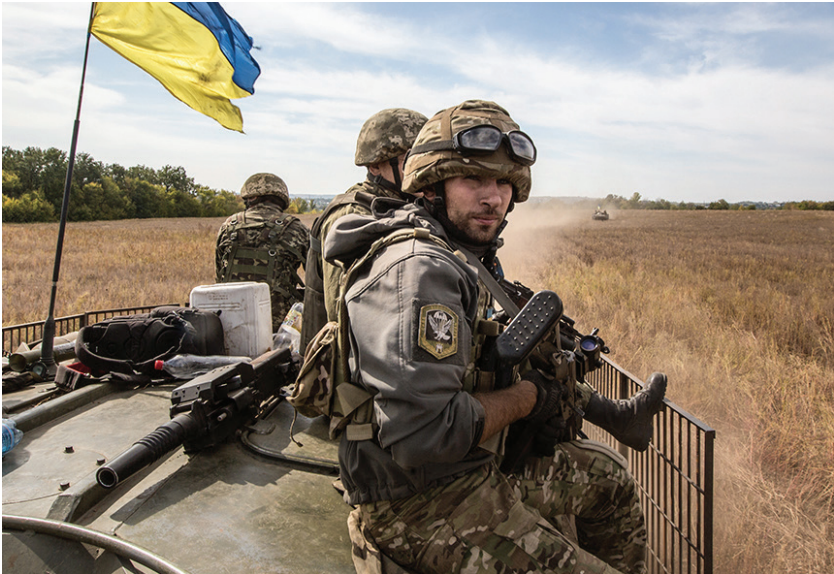
Десантники 95-й аеромобільної бригади біля міста Слов'янськ. Літо 2014 року. Експозиція: «Донбас: війна та мир»

Значну роль у протидії терористам відіграли добровольчі батальйони, сформовані з активістів Євромайдану й небайдужих громадян. Саме добровольчі підрозділи наочно продемонстрували Путіну, що українське суспільство здатне до найвищих форм самоорганізації. Небаченого масштабу досягло розгортання волонтерського руху задля підтримки українських військових та біженців із зони Східного фронту. Йдеться не тільки про добровільний збір коштів та матеріальних ресурсів: ті, хто не мав грошей намагалися виготовити потрібні на фронті речі власними руками, діти писали листи та передавали військовим власні малюнки тощо.