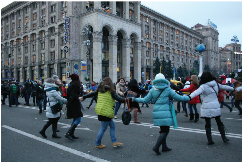
Початок ЄвроМайдану.

до півтори тисячі осіб, переважно журналісти та молодь. До них невдовзі приєдналися студенти столичних університетів, а згодом – і з регіонів. Вдень лунали виступи та пісні; ночувати на Майдані залишилися кількасот осіб. У мирній ході та мітингу на Європейській площі 24 листопада взяли участь вже понад 100 тис. людей.