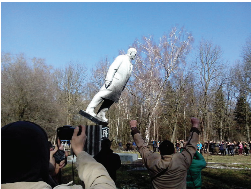
«Ленінопад» у Хмельницькому.

та комсомольських органах СРСР та радянських спец-служб. Це також було однією з вимог Євромайдану.